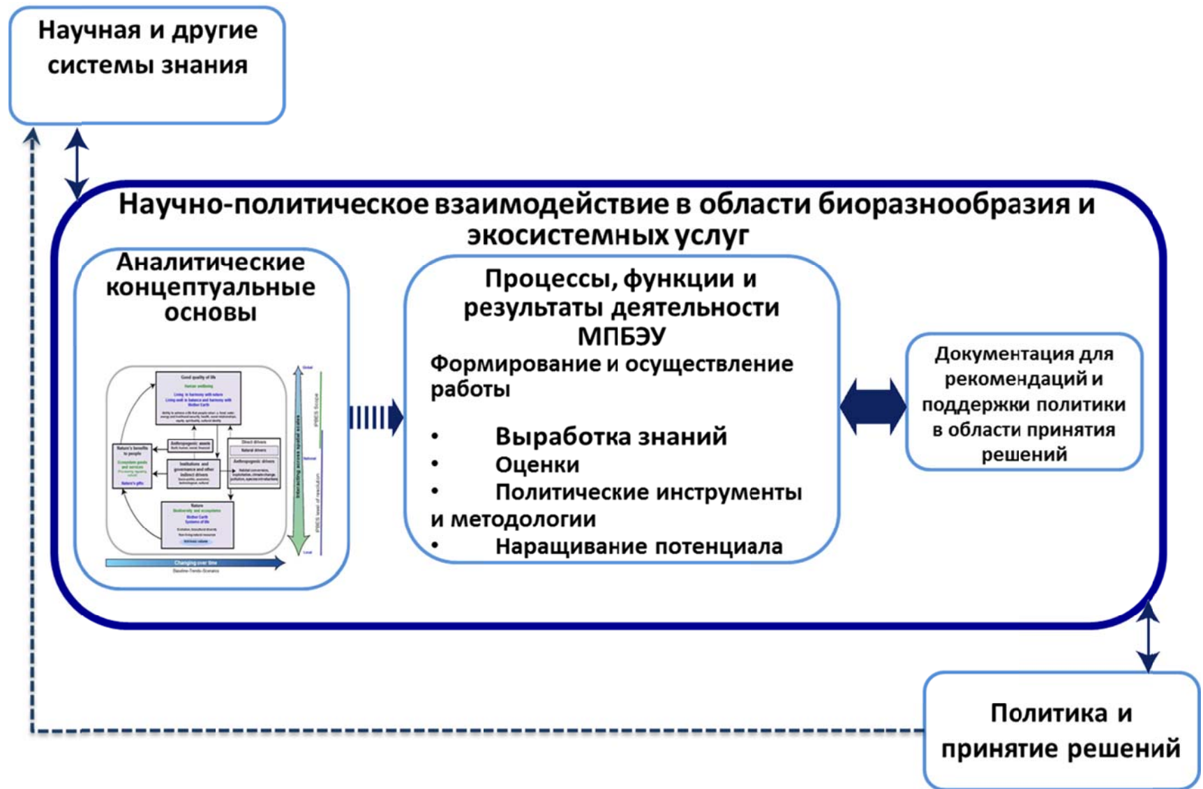
Рисунок 2 Рабочая концептуальная модель Платформы